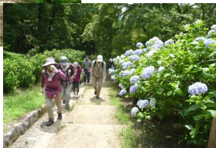
↑ あじさい小路 (かすみが城)